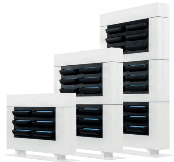
LiveDivider PLUS 1 LiveDivider PLUS 2 LiveDivider PLUS 3

Sockelplatte und Rahmen des LiveDivider PLUS bestehen aus pulverbeschichtetem Stahl und sind vollständig recycelbar.